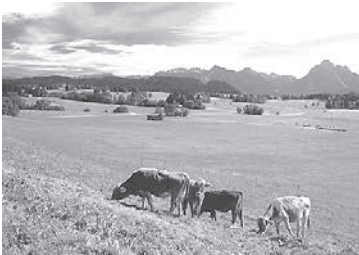
ir al campo

Póngase de acuerdo con su compañero en dos actividades y cuándo quiere hacerlas.