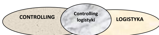
Rysunek 1. Controlling logistyki jako system złożony z controllingu i logistyki

Controlling logistyki wynika z połączenia dwóch dziedzin, tzn. controllingu oraz logistyki. Obie dyscypliny mają wiele wspólnych cech, a także elementów różniących, co prezentuje rysunek 1.