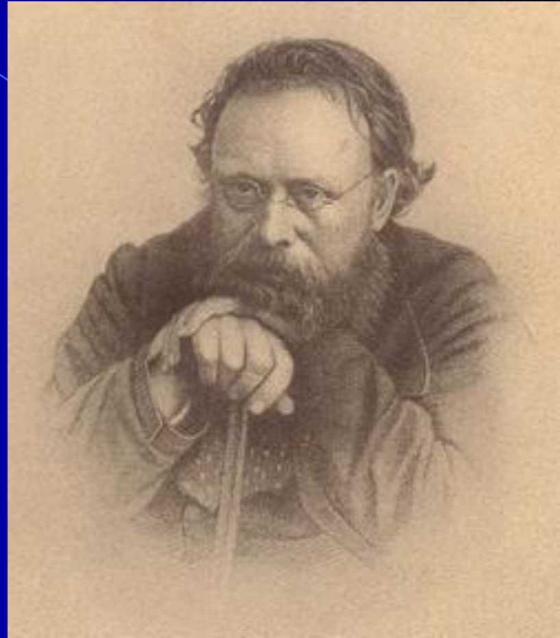
Pierre Proudhon, 1809-65

Oto rząd; oto jego sprawiedliwość; oto jego moralność.