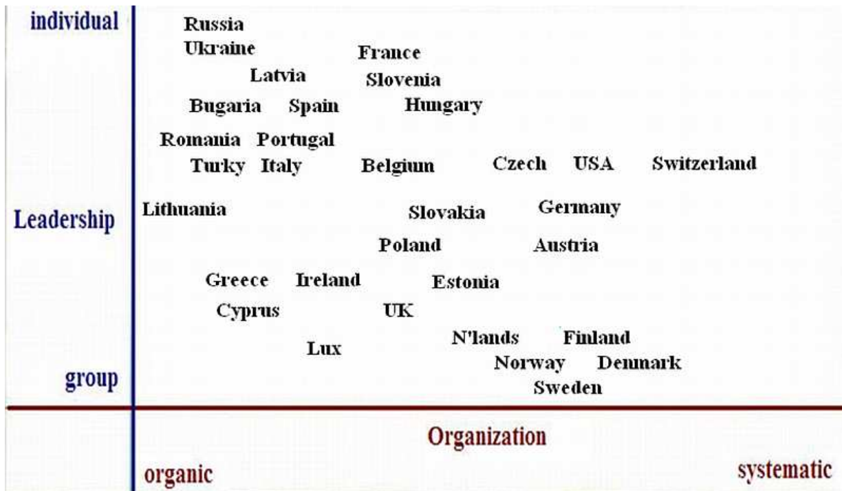
Model zarządzania międzykulturowego Johna Mola

Federalizm kulturowy poszczególne zespoły narodowe/kulturowe pracują 'po swojemu'